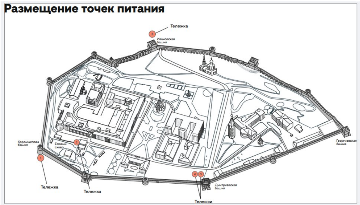
Схема размещения торговых мест